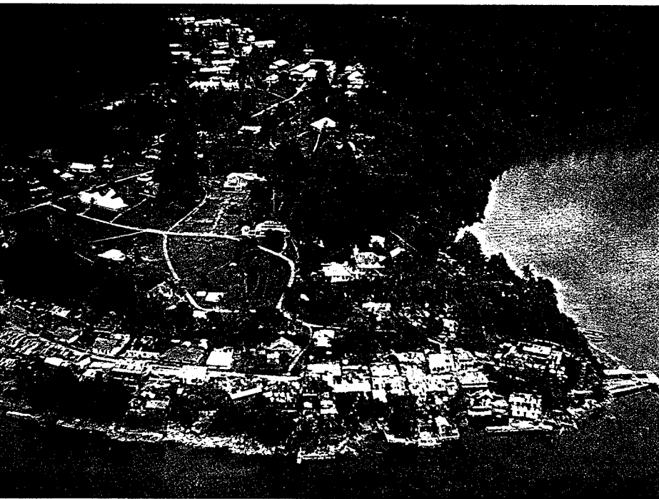
Luchtfoto van Fak-Fak

Er is brood te krijgen, doch de prijs is f 1,- voor een klein broodje. Kleine