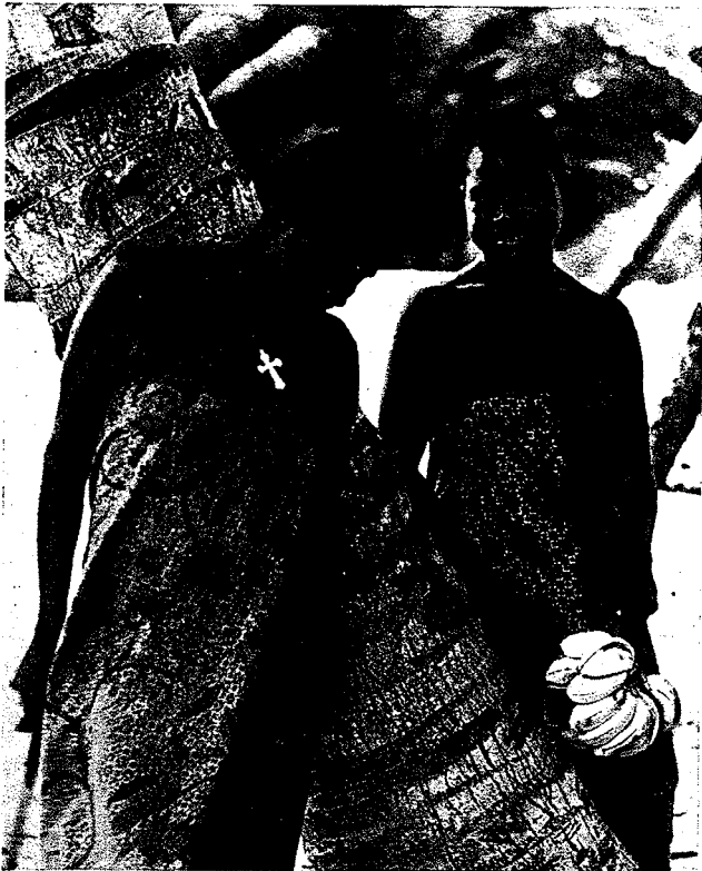
Marind-meisjes te Merauke.

Er is logeergelegenheid, maar geen pasanggrahanhouder, zodat men voor de maaltijden bij iemand te gast is of voorzien moet in eigen voeding.